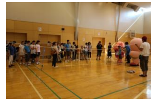
うまい棒とりゲーム！！！！