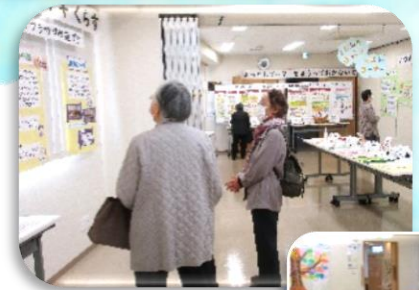
資料展示コーナー