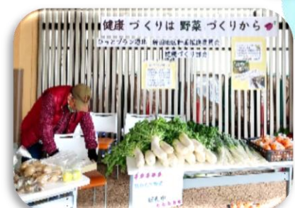
食べて元気！ 新鮮野菜