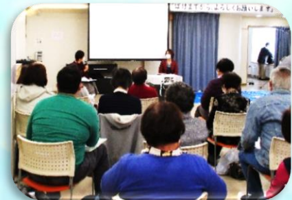
映画 & 介護経験談

展示資料の一部は12月末まで、館内2階でご紹介していますので、ぜひ見に来てくださいね！