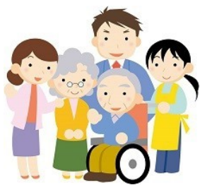
新羽町 住民・団体