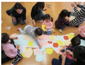
《こいのぼりイベントの様子》