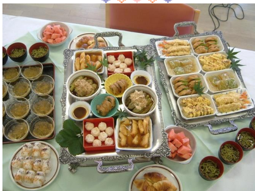
月1回の昼食会の模様