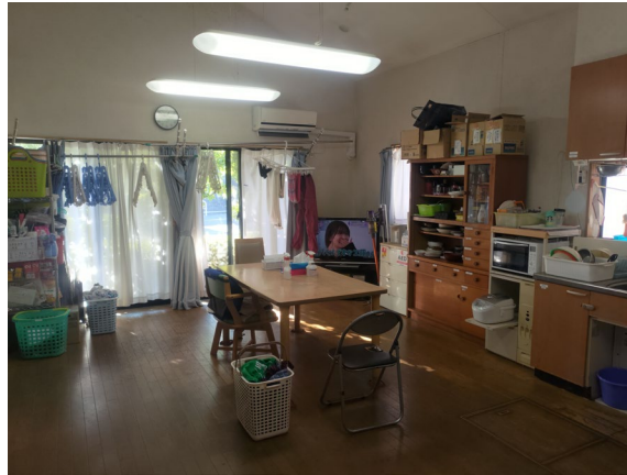
【キッチン・リビング】