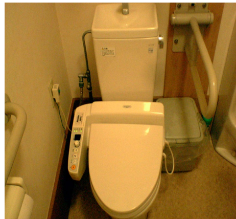
【トイレ】 車椅子で中に入れます

どなたでも気軽に遊びに来ていただける環境ですので、 お近くにお越しの際はお立ち寄りください。